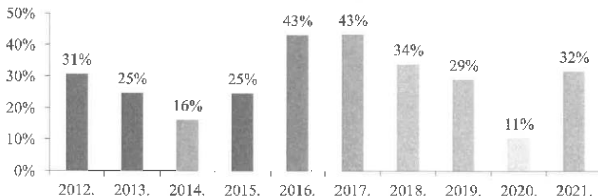
A tanulók hány %-a bukkott?

Összességében elmondható, hogy a korábbi évek javulása megtorpant, több gyerek bukkott több tantárgyból. Sok összetevője lehet ennek, de az biztos, hogy a hosszan tartó digitális oktatás is közrejátszik benne. A gyerekeknek nem volt igazán rendszeresség és normális számonkérés a tanulásukban, márpedig ennek a korosztálynak is szüksége van a határookra, szabályokra, követelményekre.